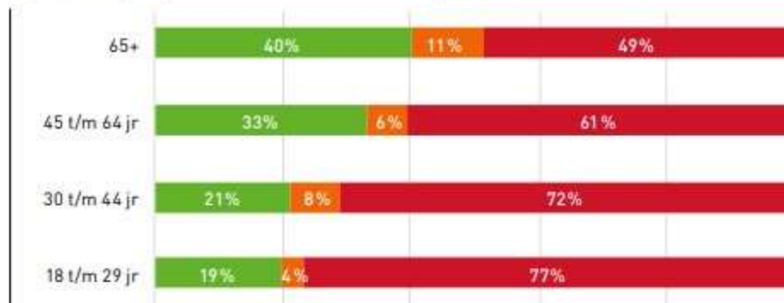
Figuur 1 Vrijwilligerswerk naar een aantal achtergrondkenmerken (n=1.613).